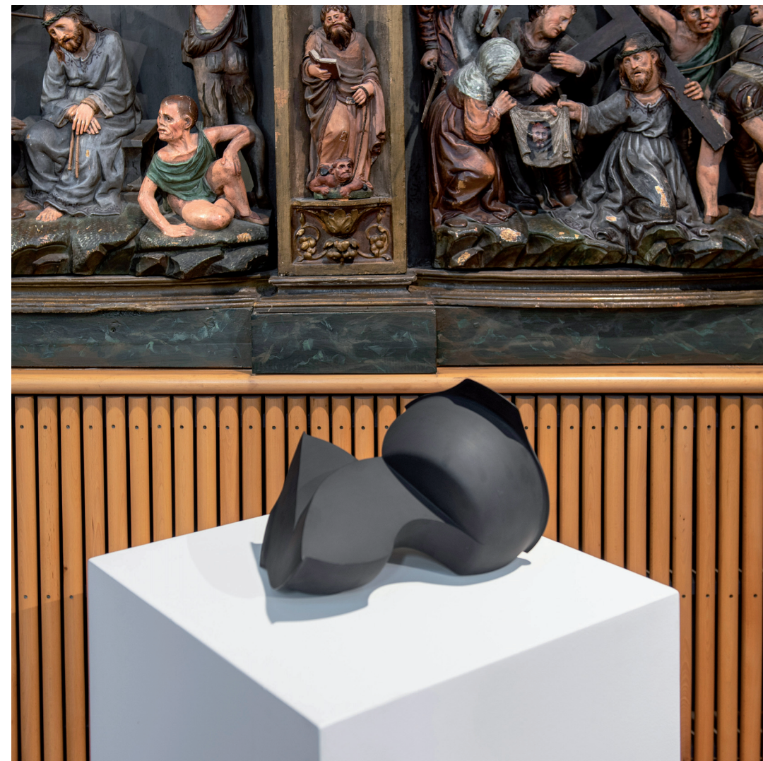
EVOLUCIÓN DE UNA FREIDORA LLENA / 2019

Erakusketa txandakatzera bultzatzen duen ziklo hori areagotu egiten da