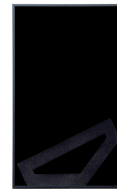
TIMELINE / 2022

de Tarragona (2009), Centro de Arte Contemporáneo Huarte (2010), Sala de Mixtos de la Ciudadela de Pamplona (2016), Galería Vetusart «Cibrian», Donostia–San Sebastián (2018), Galería Talka, Vitoria–Gasteiz (2019), Galería Altxerri, Donostia–San Sebastián (2020), Galería Luis Burgos, Madrid (2021).