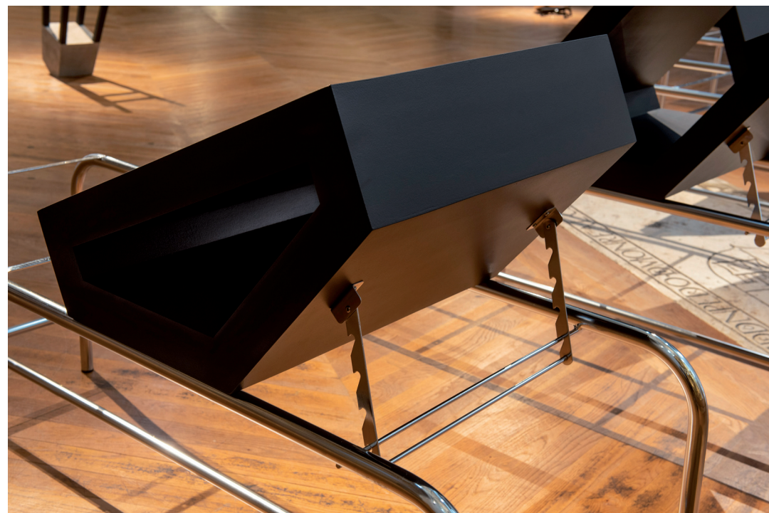
TIMELINE / 2022