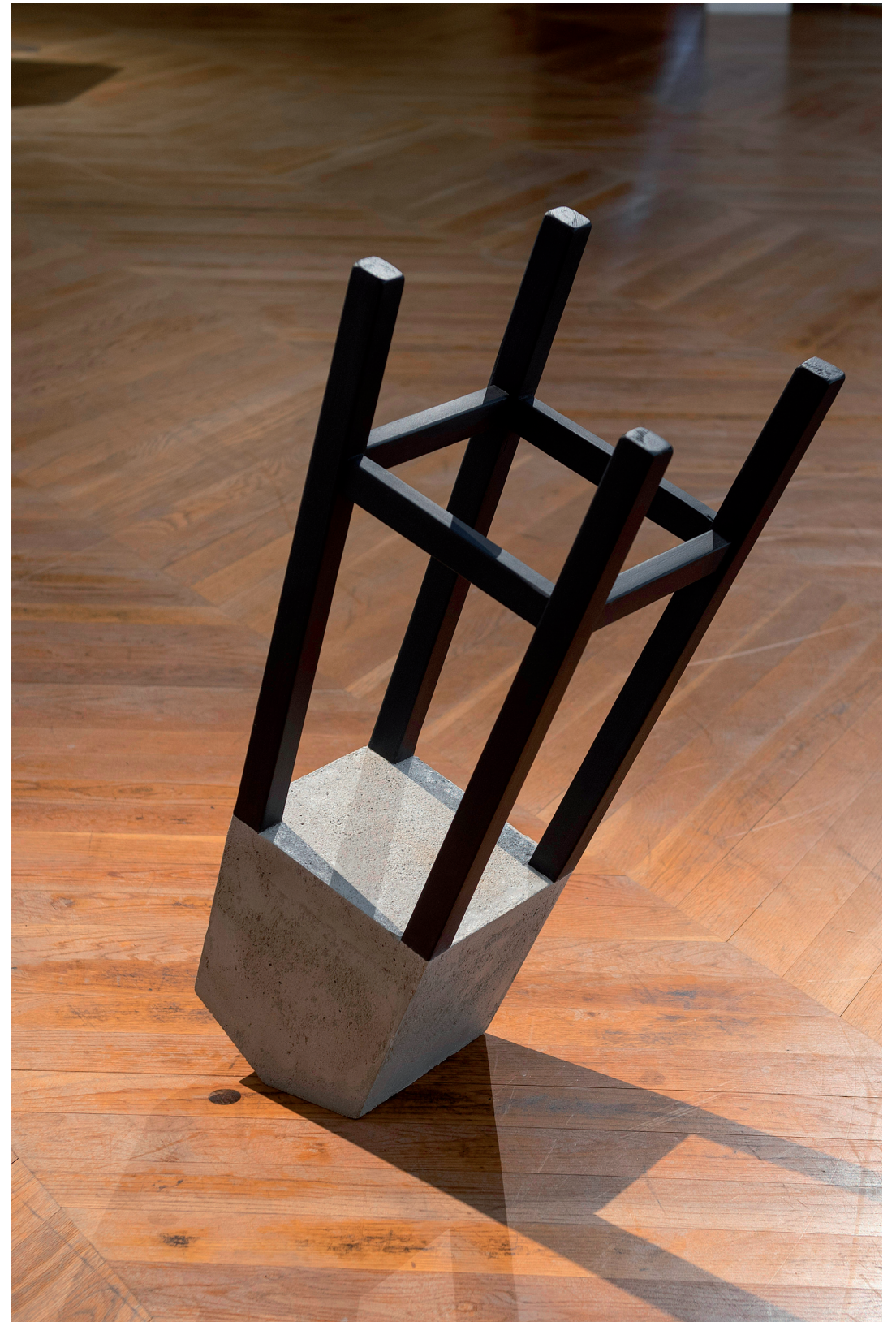
MÁS TARDE / 2021