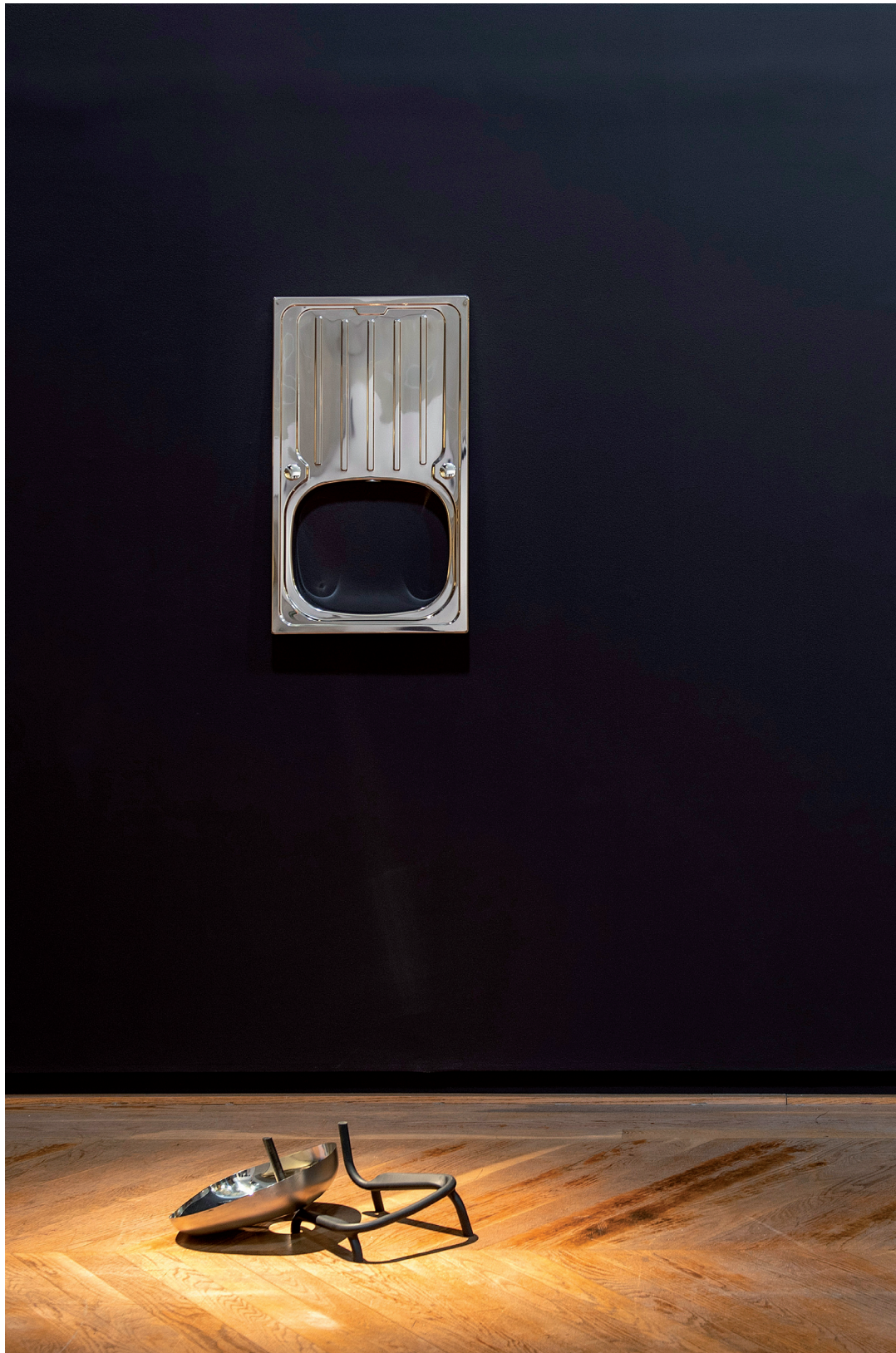
ESPERA / 2020