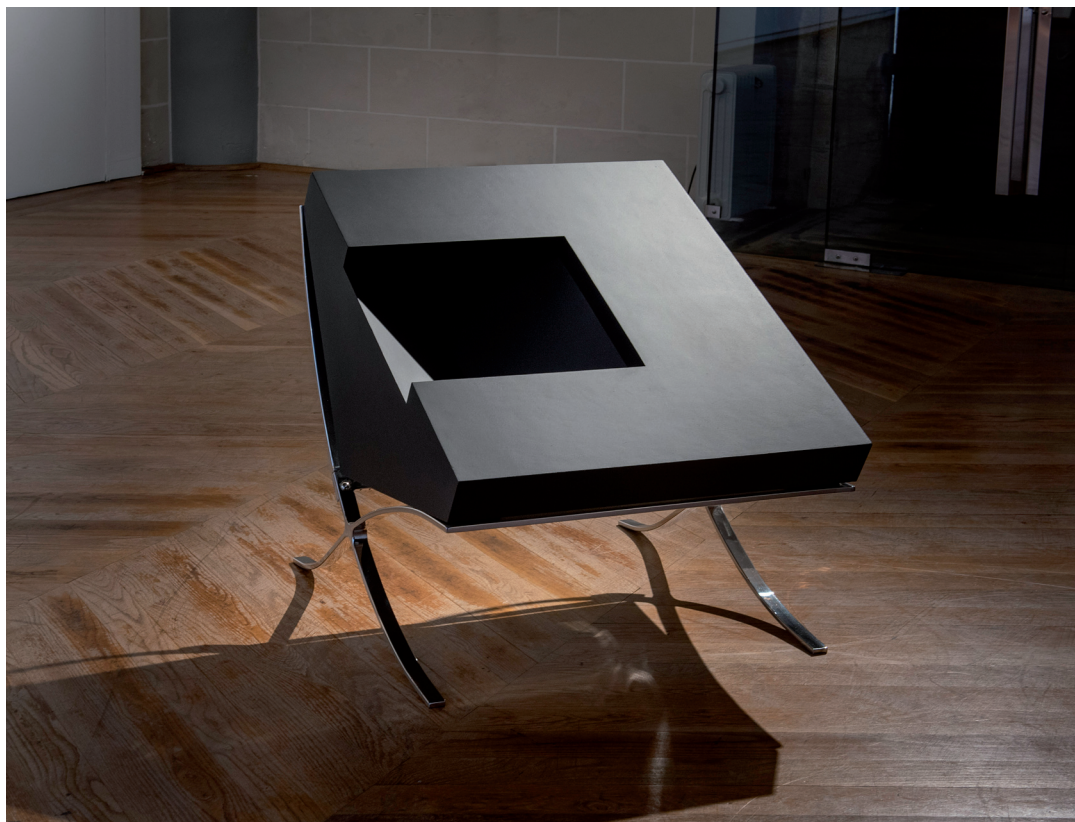
A VECES / 2020