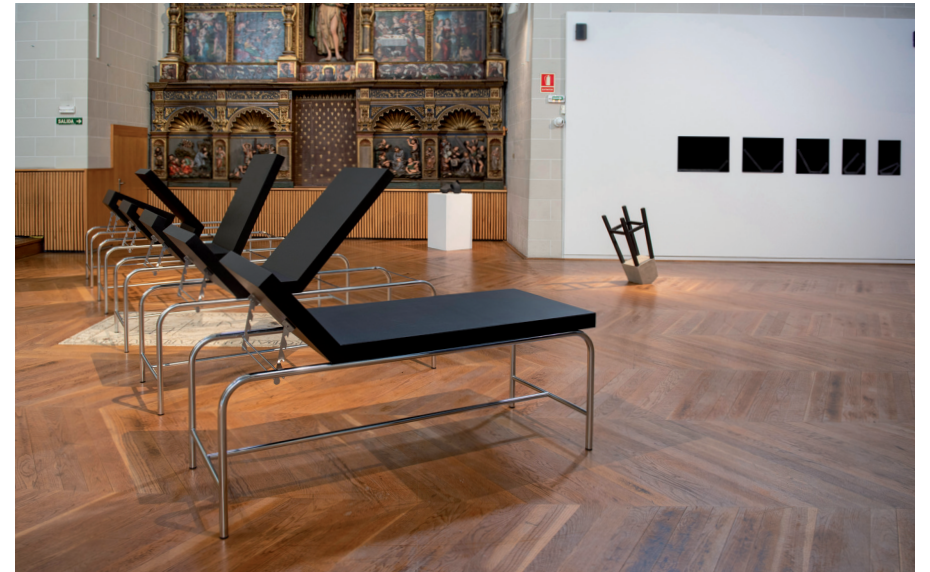
TIMELINE / 2022