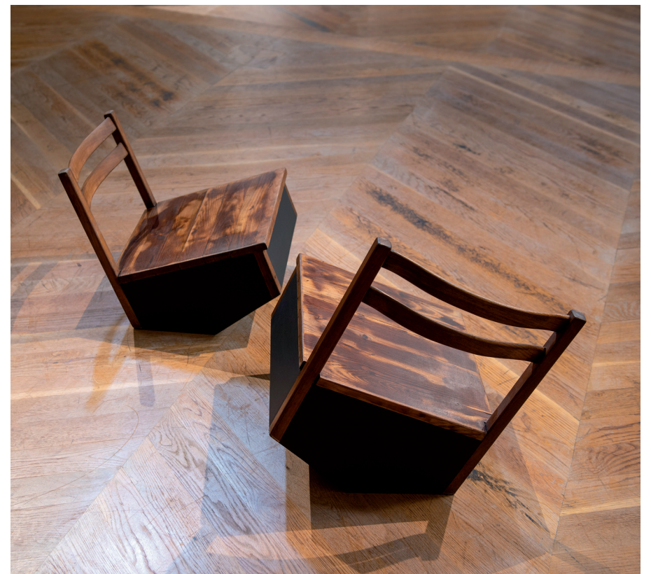
LOS DÍAS / 2022